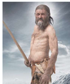
Ötzi, l'uomo venuto dal ghiaccio, esposto al Museo archeologico

creando un ambiente unico. Esplora affascinanti cittadine medievali, castelli storici e musei. Il museo archeologico di Bolzano, a soli 50 metri dalla sede di gioco, ospita "Ötzi" conservato nel ghiacciaio per oltre 5000 anni è la più antica mummia conosciuta.