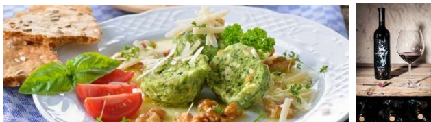
Canederli agli spinaci, il tradizionale "Schüttelbrot" e vino Lagrein

Delizia il tuo palato con la straordinaria cucina dell'Alto Adige. Assapora i sapori autentici dei