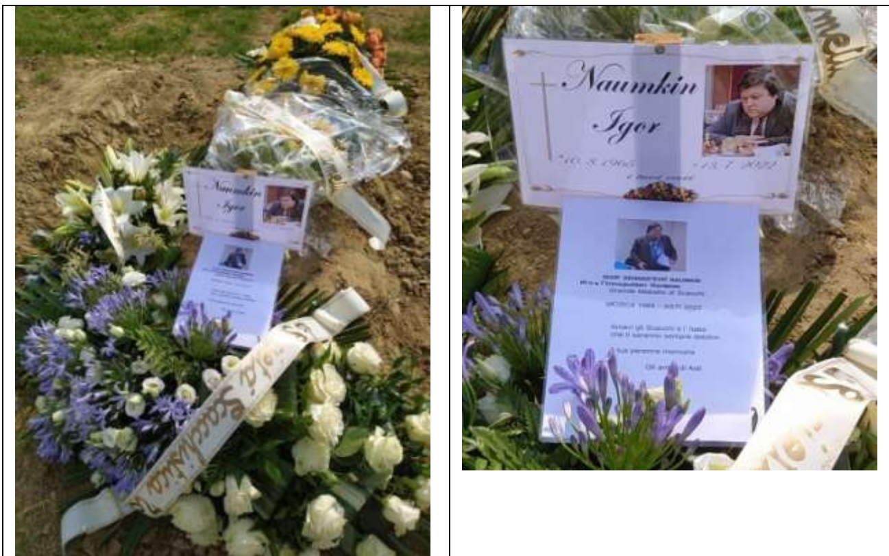
Cimitero di Asti

La tomba così è provvisoria, dopo un anno la sistemano e mettono la lapide