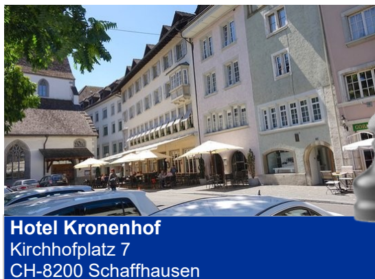
Hotel Kronenhof Kirchhofplatz 7 CH-8200 Schaffhausen