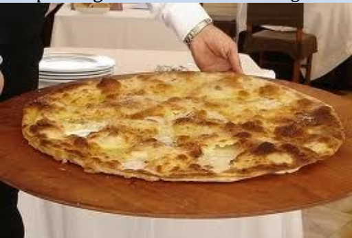
"La famosa focaccia di Recco IGP"