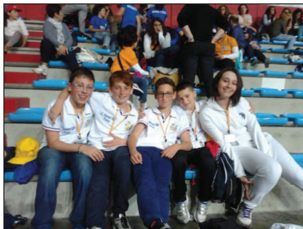
Istituto Comprensivo Pineto