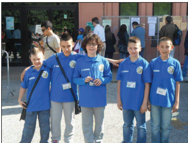
Istituto Comprensivo Castellalto

GSS - Campionati Giovanili Studenteschi Montecatini 2013