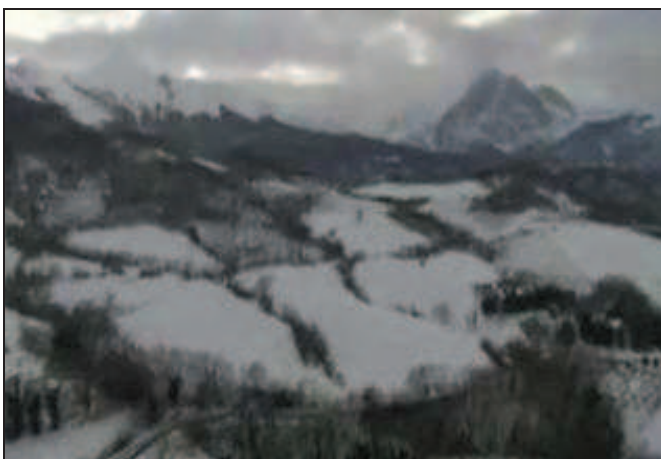
Il Gran Sasso d'Italia