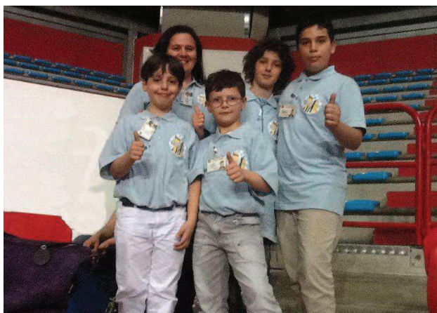
Istituto Comprensivo Roseto degli Abruzzi